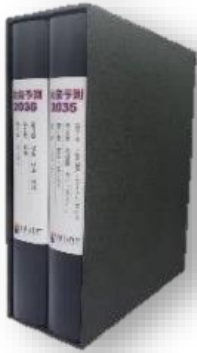
未来予測レポート